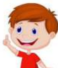
Факт, который удивил