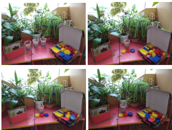
Рисунок 1 – Использование блоков, карточек-символов при наблюдении за животными и растениями

Использование блоков, карточек-символов при наблюдении за животными и растениями. Так при сравнительном наблюдении за ростом зеленого лука на подоконнике и зависимостью его развития от влаги, света и тепла, я ввожу условные обозначения: вода – синий круг, тепло – красный круг, свет – желтый круг; толстыми блоками обозначаем достаточное количество, а тонкими – ограниченное количество, света, влаги и тепла [4].