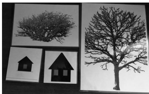
Рисунок 2 – Использование кодовых карточек

С помощью кодовых карточек и блоков обозначаю выделенные признаки (размер, форму, цвет и др.) при характеристике или сравнении объектов природы (дерево – кодовой карточкой, обозначающей большой размер, а куст, соответственно, символом, обозначающий маленький размер и т. д.).